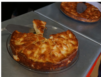
Goûter du mercredi