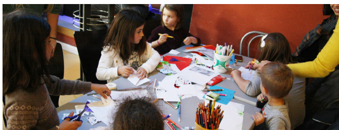
Animation du mercredi