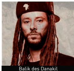
Balik des Danakil