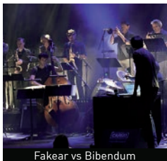
Fakear vs Bibendum

■ VLP Vive La Peinture est un des plus anciens groupes français de Street Art toujours en activité. Plus de trois décennies qu'ils fonctionnent "comme un groupe de rock qui privilégierait le live à l'enregistrement studio". Ils effectueront une performance scénique en compagnie du guitariste iconoclaste Phil Reptil (Mina Agossi, Zarboth, Maisons Maquets...), intervenant musique de La CLEF.