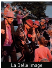
La Belle Image

■ Tous les deux ans, nos adhérents d'Arts Plastiques font leur "Biennale", l'occasion de mettre en valeur leur travail dans une scénographie adaptée. À l'occasion des 30 ans, la Ville nous met à disposition l'Espace permanent Véra. Le vernissage se fera en musique (chant et piano) avec des interventions de nos cours de musique. L'exposition restera ouverte jusqu'au 14 juin.