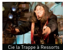
Cie La Trappe à Ressorts

■ Les adhérents de La CLEF (notamment les ateliers d'impro) et de l'AGASEC investiront les allées du marché pour des interventions insolites et improvisées.