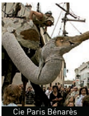
Cie Paris Bénarès