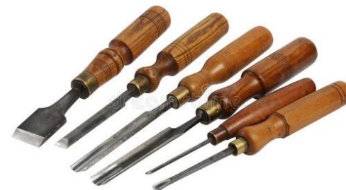
Burins de sculpteur