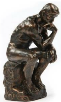
Le Penseur de Rodin

Tailler : L'artiste pour créer une sculpture, taille une matière à l'aide d'outils (par exemple le burin), pour lui donner la forme qu'il a imaginée. La matière utilisée peut être l'ardoise, mais aussi le bois ou la pierre.